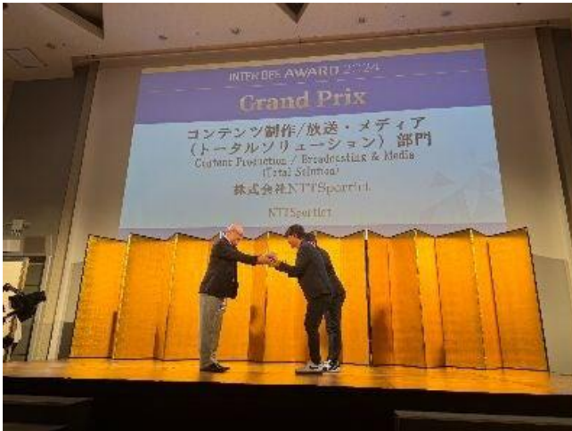
表彰式でのトロフィーの授与