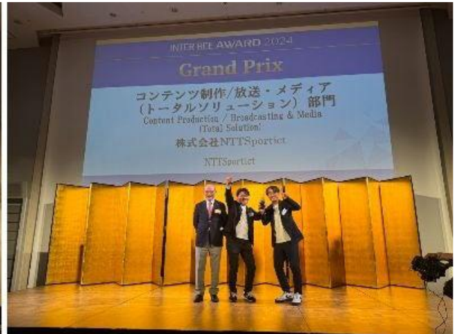
システム開発メンバーが表彰される様子