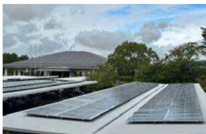
左) 駐車場屋根の太陽光パネル