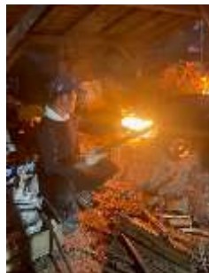
左) 場内アカマツ間伐材は再利用、右) 間伐材の「丹波立杭焼」窯元への提供