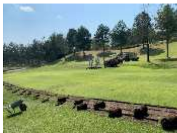
中) 廃芝生の剥離・再利用、右) 芝生提供先の保育園児招待のゴルフ場開放