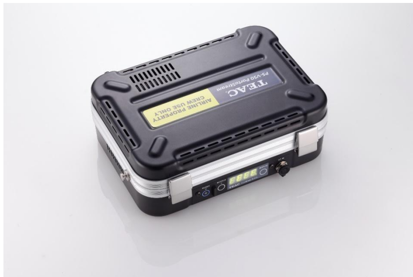
機内に搭載されるインフライトサーバー